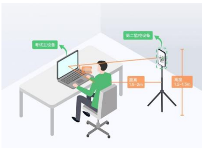
图 16 监控环境示意图