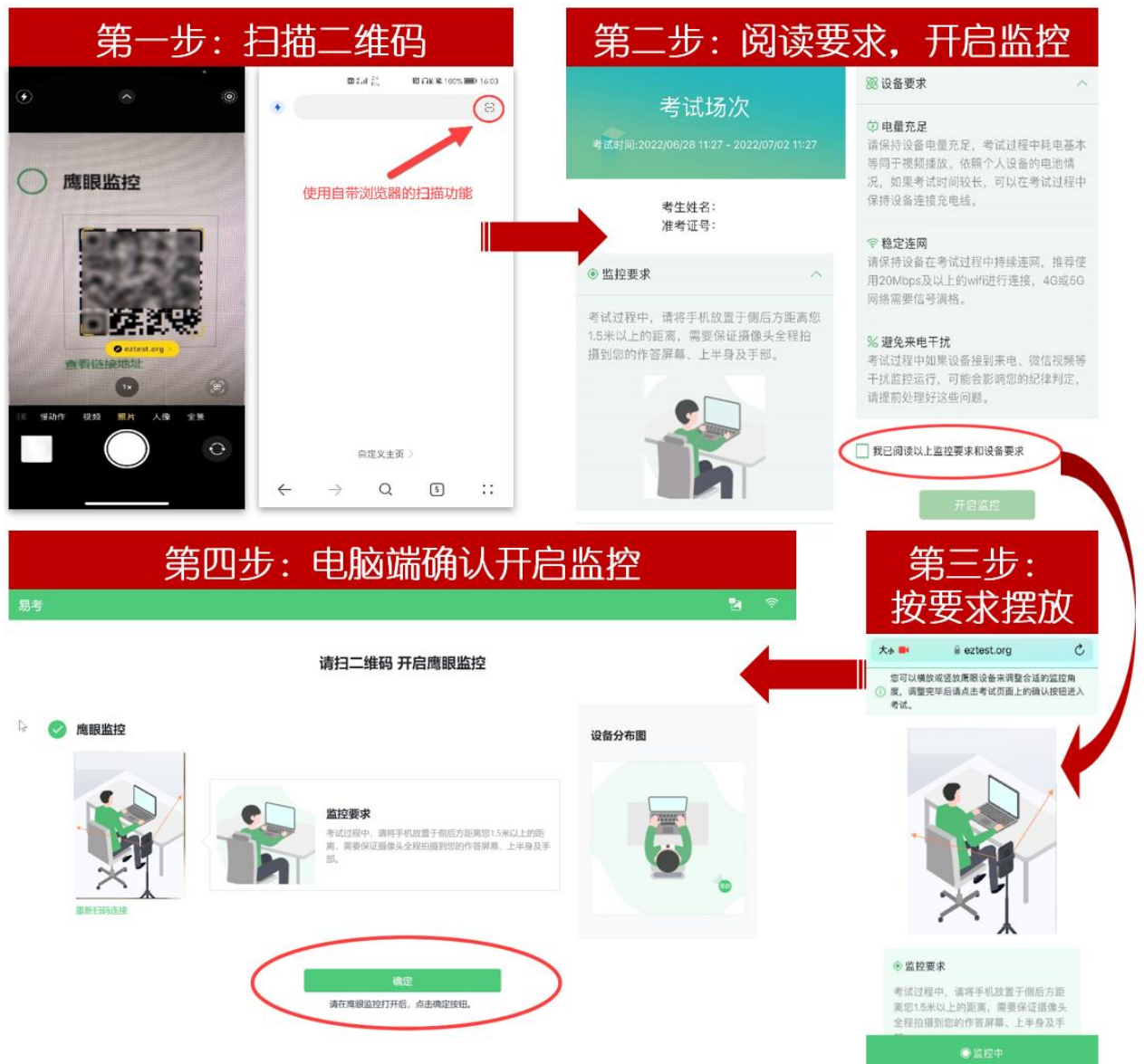
图 11 开启鹰眼步骤图