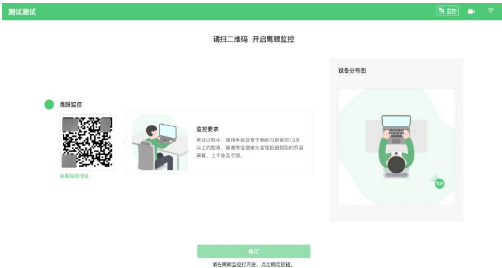
图 10 鹰眼登录