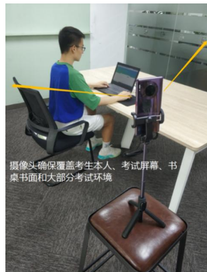
图 17 监控环境实景图

请注意： 考试过程中采集的监控信息，将只允许考试主办方查阅，作为判定考生是否遵守考试规则的辅助依据；不会用在除此之外的其他用途。